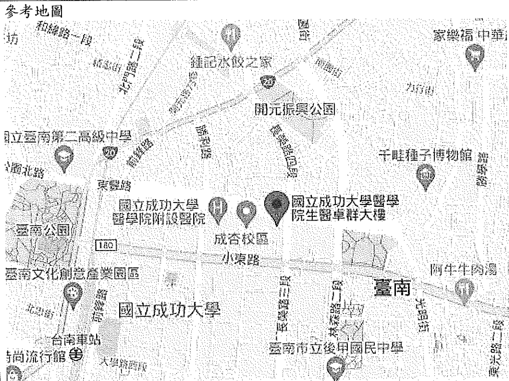
成杏校區位置圖及校內位置圖